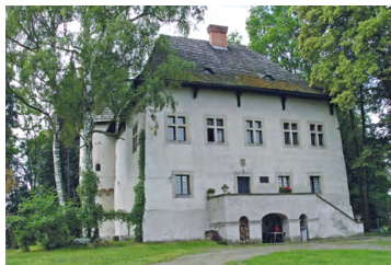
Dwór w Jezowie

Rozpoczynamy trasę. Z drogi głównej – ul. Węgierskiej – skręcamy w lewo, w ul. Długoszowskich. Po przekroczeniu linii kolejowej i mostu na Białej skręcamy 500 m dalej w lewo, w ul. Graniczną.