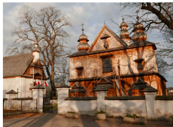
Kościół w Szalowej