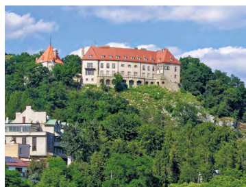
Zamek w Przegorzalцах

21,3 E Zamek w Przegorzalцах – widoczny na skraju Lasu Wolskiego i posadowiony nad Skatami Pienińskimi jest jednym z niewielu dzieł architektury III Rzeszy na terenie Krakowa. Obecnie przekształcany w nowoczesny ośrodek hotelowy z restauracją.