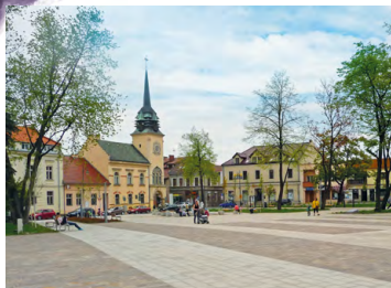
Rynek w Skawinie

16,3 D Korabniki, zespół dworski – renesansowy dwór obronny z XVI w. z rozciągającym się wokół zabytkowym parkiem; obecnie w rękach prywatnych.