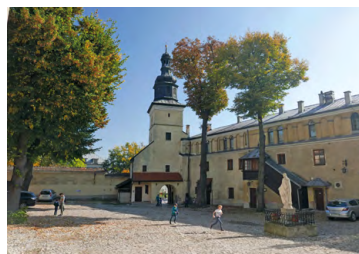
Klasztor Norbertanek na Zwierzyńcu

16,8 D Klasztor Norbertanek na Zwierzyńcu. Początki tego opactwa sięgają 2 poł XII w. Wielokrotnie niszczone, między innymi w 1241 r. przez Tatarów. Obecny wygląd w stylu barokowym nadano mu w trakcie XVII-wiecznej przebudowy.