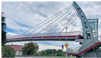
Kładka (z windą) nad Zakopianką

19,9 Przekraczamy Zakopiankę – na drugą stronę przejedziemy nowoczesną kładką, na którą wyjedziemy...windą.