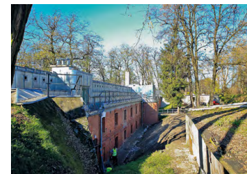
Fort Skotniki 52 1/2 (południowy)

5,3 B Fort Skotniki 52 1/2 (północny) wybudowany przez Austriaków w latach 1897–1898. Stanowił podziemny punkt obronny Twierdzy Kraków. Niedostępny do zwiedzania. Po