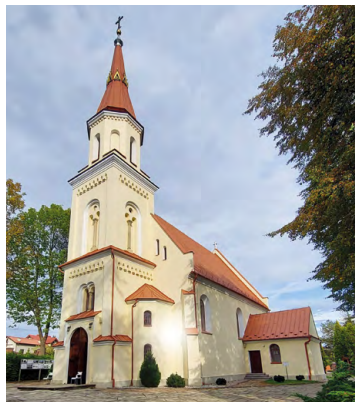
Sanktuarium w Gaju

28,2 Przed nami ostry zjazd do głębokiej doliny, a po przekroczeniu potoku kładką dla pieszych, czeka nas stromy podjazd, zmuszający początkowo do wypychania roweru pod górę.