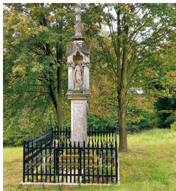
Kapliczka – przed Mogilanami na podjeździe

Kontakt: Winnica Gaj ul. Latochówki 5, 32-031 Mogilany tel. 608 591 960 www.facebook.com/winnicagaj