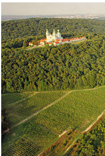
Widok na klasztor Kamedułów na Bielanae i Winnicę Srebrna Góra

F Klasztor Kamedułów na Bielanae (dzielnica Krakowa) – malowniczo położony w Lesie Wolskim, na wzgórzu zwanym Srebrną Górą. Wzniesiony został na początku XVII w. To jeden z dwóch klasztorów w Polsce tego zgromadzenia, słynącego z surowej reguły i pustelniczego życia.